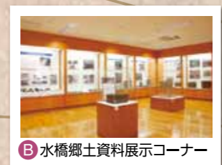
B 水橋郷土資料展示コーナー