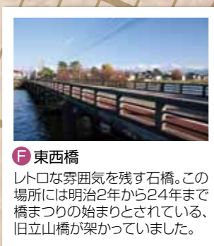
F 東西橋 レトロな雰囲気を残す石橋。この場所には明治2年から24年まで橋まつりの始まりとされている、旧立山橋が架かっていました。