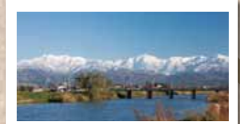
A 立山あおぐ特等席