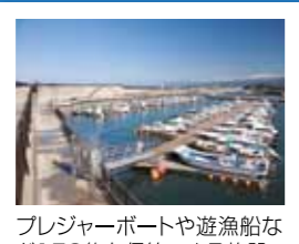
プレジャーボートや遊漁船など150隻を保管できる施設。