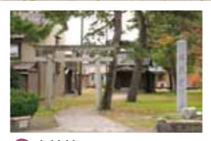
G 水神社 明治2年に初めて橋が架けられたことへの感謝と河川の安泰を願って建立された神社。これが、今なお続く橋まつりの由来です。